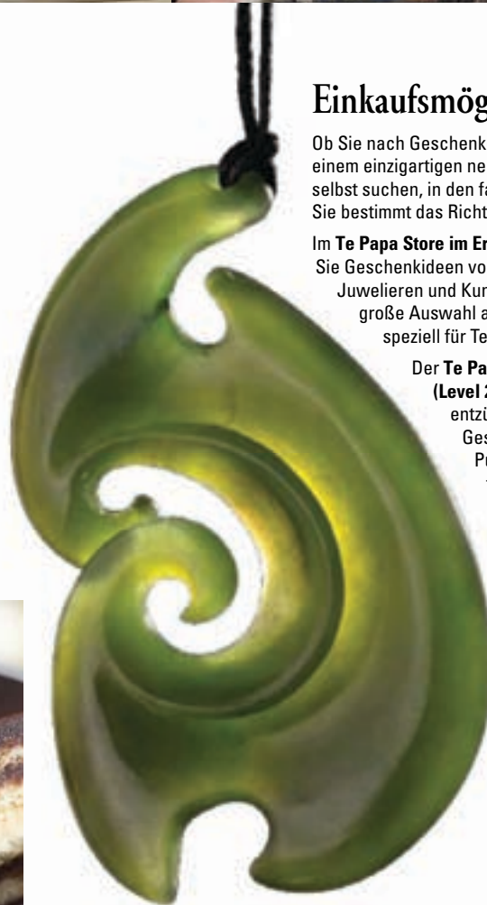
Anhänger, Hepi Maxwell, geschnitzte Jade.

Sie können auch online im Te Papa Store bestellen unter: www.tepapastore.co.nz