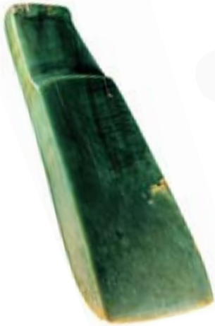
Toki pounamu (Dechsell), 1300-1500, Stamm unbekannt.