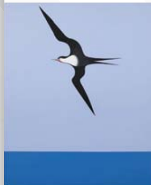
Pacific frigate bird 1 (Ausschnitt) 1968, Don Binney.

Im Level 4 Espresso im 3. Stock können Sie sich bei Getränken und leichten Speisen im Herzen von Te Papa entspannen.