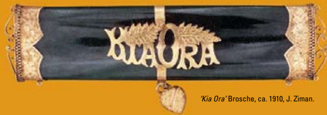
'Kia Ora' Brosche, ca. 1910, J. Ziman.

Willkommen in unserem Nationalmuseum, dem Museum of New Zealand Te Papa Tongarewa! Im Te Papa erfahren Sie so viel über dieses Land – über seine einzigartige Naturgeschichte, über die verschiedenen Nationalitäten, die hier leben, über die charakteristische Kunst dieses Landes sowie die authentische Kultur der einheimischen Māori.