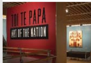
Eingang zu Toi Te Papa Art of the Nation. Im Hintergrund Whakapiri atu te whenua , 1993, Shane Cotton.

Toi Te Papa Art of the Nation , Te Papas bedeutendste Kunstausstellung, nimmt das gesamte 4. Stockwerk ein (Level 5). Hier sind über 300 eindrucksvolle klassische und zeitgenössische Kunstwerke aus der Sammlung von Te Papa ausgestellt. Hier können Sie sich mit Neuseelands vielfältigem kulturellem Erbe vertraut machen.